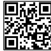
Unser Zeichen 4Wheel.travel

Facebook: www.facebook.com/4wheel.travel Google + : https://plus.google.com/+4x4ReisenDE/posts web/mail: www.4wheel.travel / thailand@4wheel.travel Tel. : +66 (0) 81 86 84 708 / +49 (0) 30 868709401