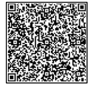
Datum Bangkok, 19.12.201414