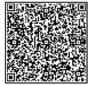
Datum Bangkok, 20.12.201414