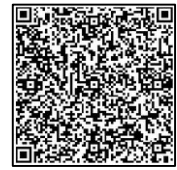
Datum Bangkok, 21.12.201414